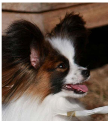
Feminint huvud och uttryck/Maskulint huvud och uttryck (Även en hane kan ha ett sött uttryck!)