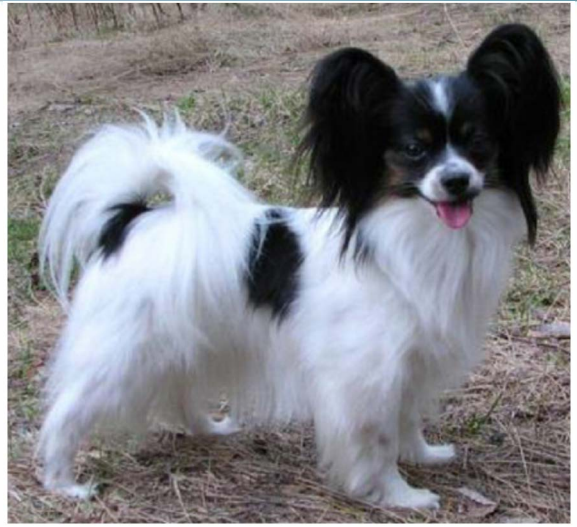
En tik med sparsam men helt ok päls.