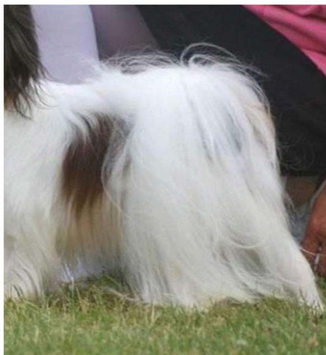
Allt för platt svans.