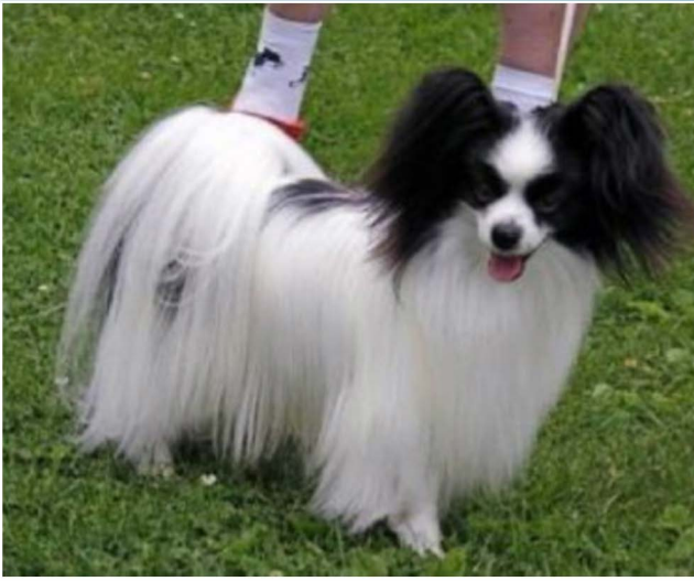
En hanhund med riklig päls.