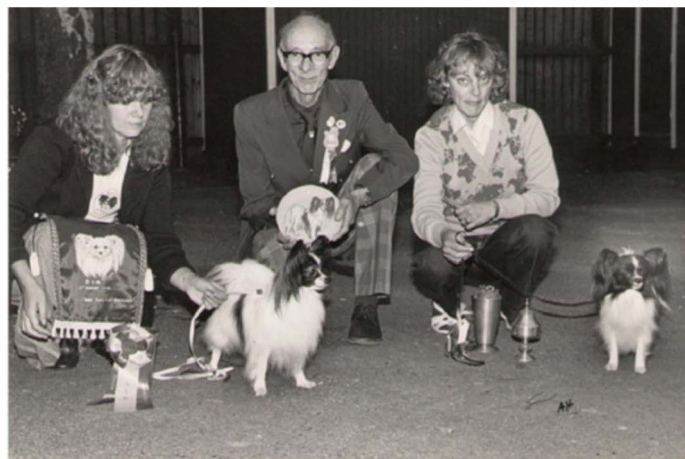
Vinstrika hundar på tidigt 80-tal.