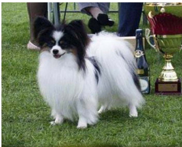
Bra svans med fin höjd.

Svansen är mycket viktig på rasen. Öron och svans tar fram siluetten på Papillon. Idag har vi mycket platta svansar.