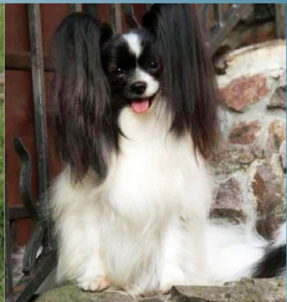
Tre hundar med mycket bra öron, (sista hunden - Mycket öronbehäng, sällsynt men imponerande.)