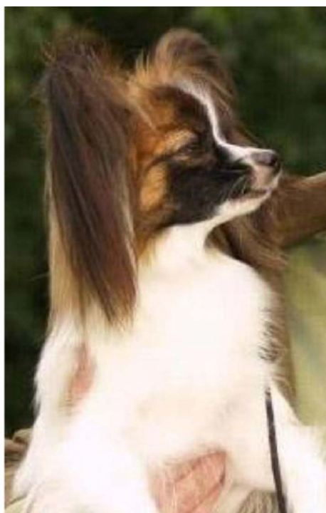
Vackra öron och vackert huvud.

Man eftersträvar fransar hos papillon eftersom de ger öronen den likhet med fjärilsvingar, som är så typiskt för rasen.